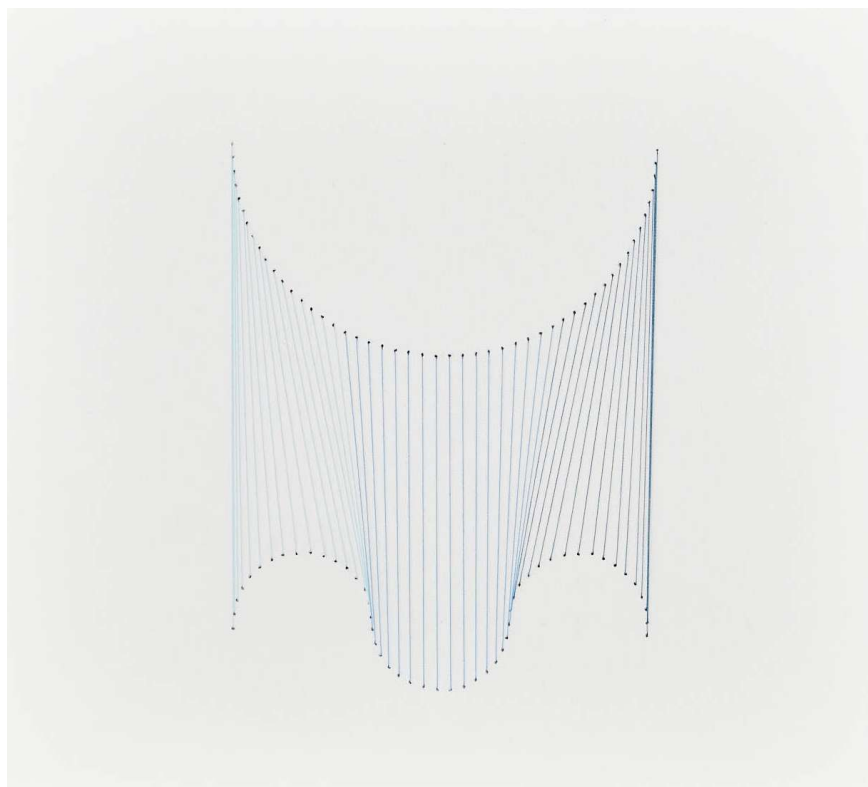
Curva F1 Fils sur papier, 22,8x25,5cm 2018

Vernissage Jeudi 25 octobre 2018 18H00 – 21H00