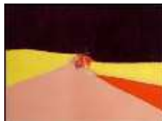
Nicolas de Staël Agrigente , 1954 60 x 81 cm Tefaf 2015