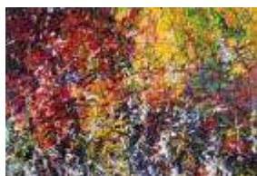
Jean-Paul Riopelle Hommage à Robert le Diable 1953, 200 x 282 cm Tefaf 2010