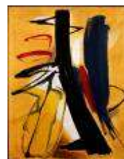
Hans Hartung T 1938-11 , 1938 102 x 80 cm Fiac 2011