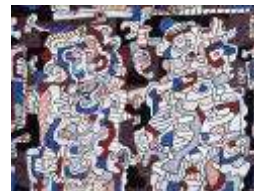
Jean Dubuffet Epoux en visite , 1964 200 x 150 cm Biennale 2010

APPLICAT-PRAZAN Rive gauche 16 rue de Seine – 75006 Paris