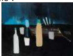
Nicolas de Staël La Table de l'Artiste , 1954 89 x 116 cm Biennale 2008

Certaines peintures ont été particulièrement remarquées ces dernières années. Citons par exemple :