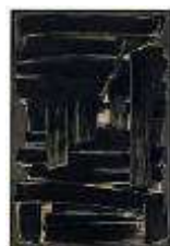
Pierre Soulages Peinture 195 x 130 cm, 1 er sept. 1957 Fiac 2009