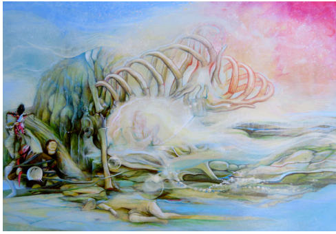
ROBERT GUTIERREZ, PRIMER, 2018 GOUACHE ET CRAYON SUR PAINNEAU D'ARGILE, 29 X 30 CM COURTESY DE L'ARTISTE ET GALERIE NATHALIE OBADIA, PARIS / BRUXELLES