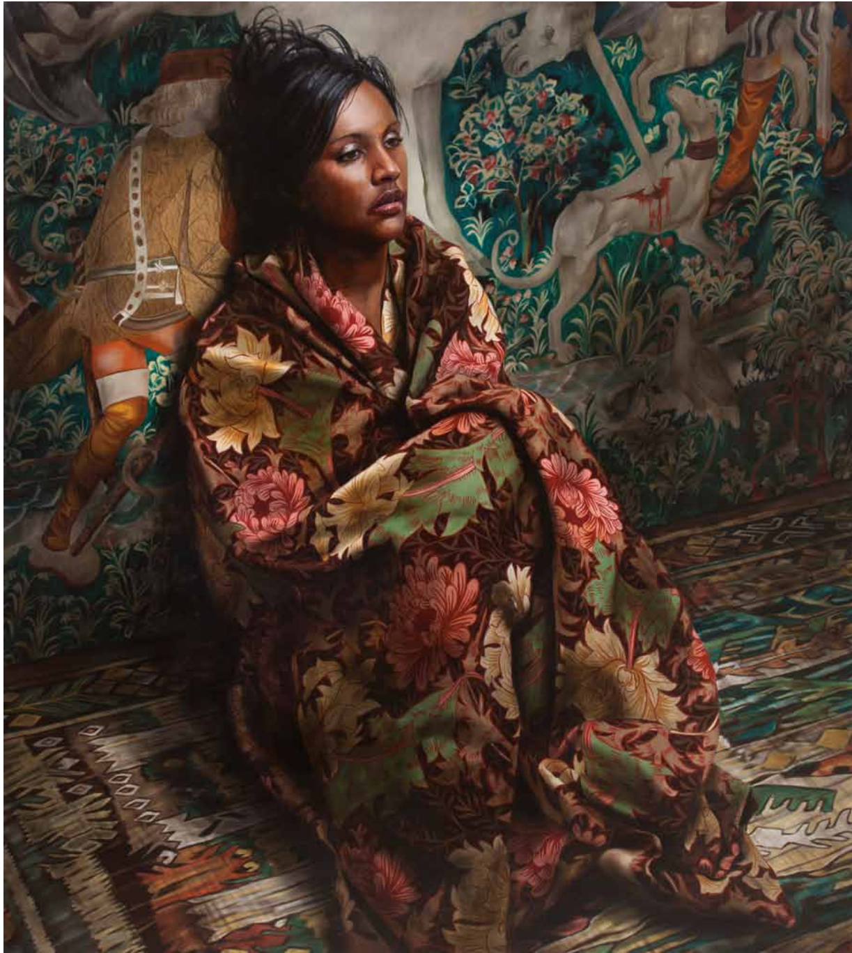
Markus Åkesson, The Unicorn Hunt II, huile sur toile, 200 x 170 cm, 2017