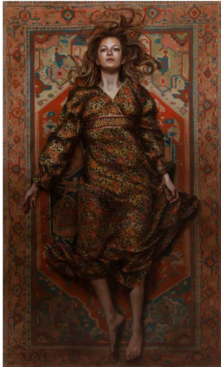
Markus Åkesson, Let me sleep through the night (Somnium), huile sur toile, 210 x 100 cm, 2017 Courtesy de l'artiste et la Galerie Da-End