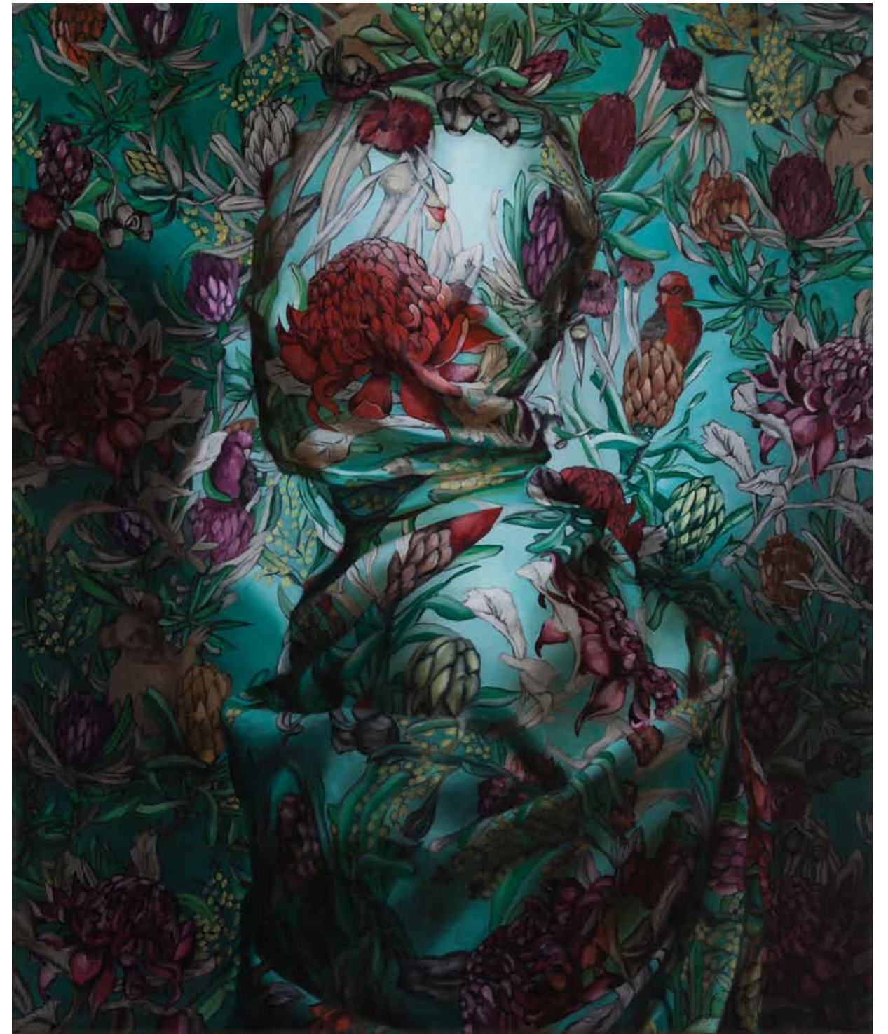
Markus Åkesson, No one can see you (Dysmorphia II), huile sur toile, 50 x 60 cm, 2017 Courtesy de l'artiste et la Galerie Da-End