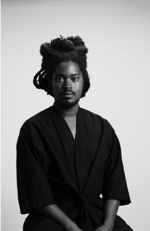
Julien Creuzet

Julien Creuzet crée des œuvres protéiformes mêlant poésie, musique, sculpture, assemblage, film et animation. Évoquant les transactions postcoloniales transocéaniques en relation avec de multiples temporalités, l'artiste place son propre héritage passé, présent et futur au cœur de sa production. Échappant aux récits généralisés et aux réductions culturelles, le travail de Creuzet met souvent en lumière les anachronismes et les réalités sociales pour construire des objets irréductibles. Semblables à des reliques du futur ramenées à terre par une marée océanique, les œuvres de Creuzet se matérialisent comme des témoignages amplifiés de l'histoire, de la technologie, de la géographie et de soi.