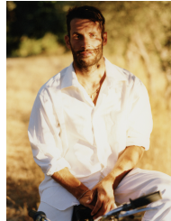
Simon Porte Jacquemus