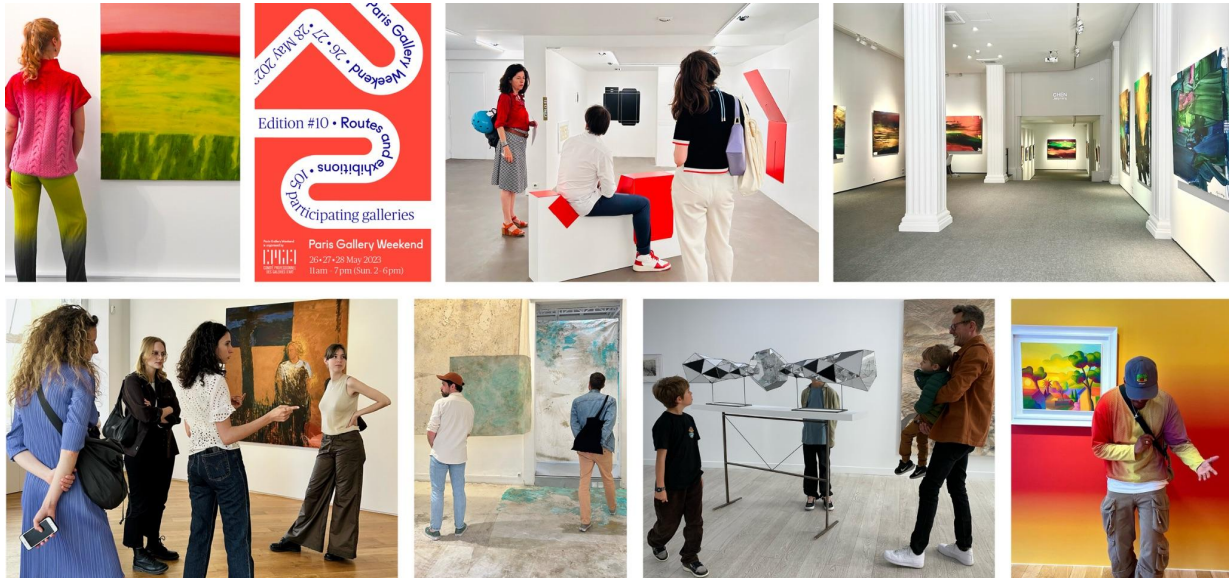
Vue des galeries Romero Paprocki, Maubert, Taménaga, Lelong & Co, Papillon, Wagner, Perrotin