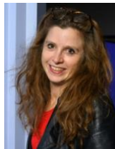
ANAËL PIGEAT Critique d'art et commissaire d'exposition, ancienne rédactrice en chef d'Art Press, auteure de diverses publications artistiques.